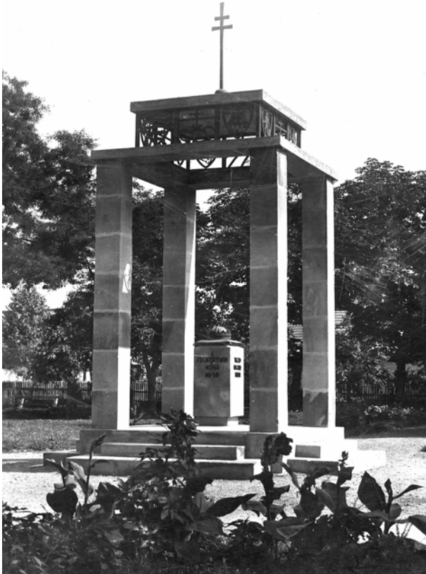
Ez a régi Szt. István emlékmű a Szentkoronával, amely kétszer tűnt el